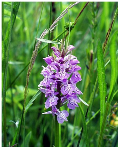
Prairies du Fouzon - C'Picaux